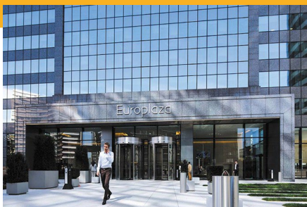
Tour Europlaza - La Défense

179 Av. Frederic et Irene Joliot Curie 92000 Nanterre