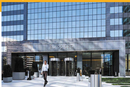
Tour Europlaza - La Défense

179 Av. Frederic et Irene Joliot Curie 92000 Nanterre